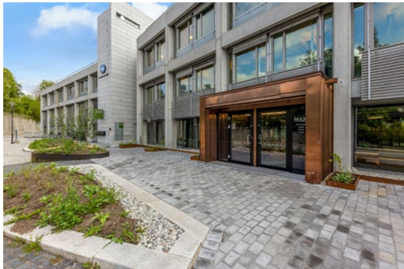
Instituttets nye tilholdssted i Maridalsveien.